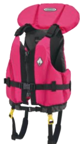
ライフジャケット