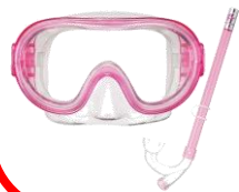
シュノーケルセット

足入れタイプの浮き輪はお子様在水中を覗き込んだ際に、起き上がることができず溺れる事故が多発しています。