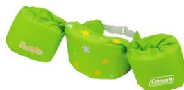
ベスト一体型アームリング